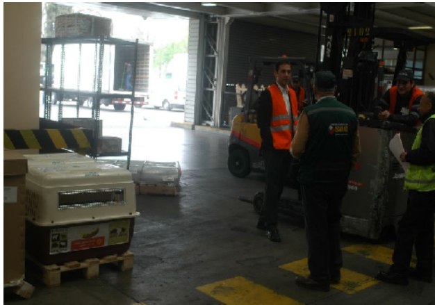
Les gossetes van ser rebudes pel secretari regional d'agricultura.