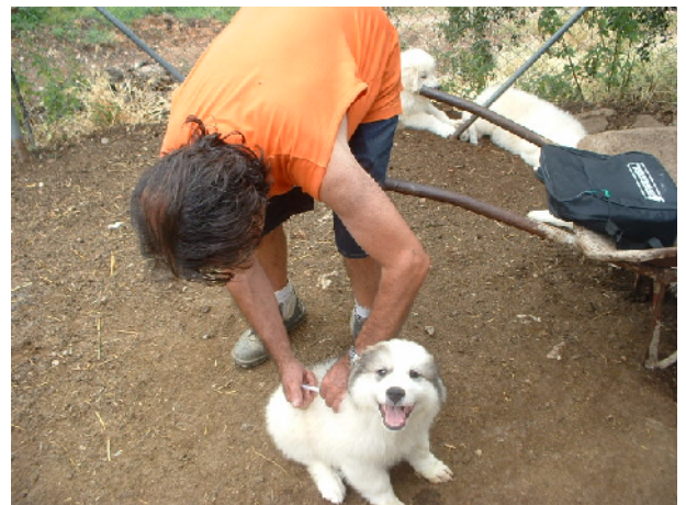
Un tècnic de l'Institut efectuant la quarta desparasitació i la segona dosi de vacunes a Cal Gilet.