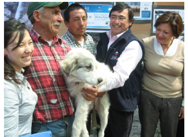
El director de la FIA fa el lliurament oficial d'una de les gossetes a un ramader en presència de la Ministra d'Agricultura, de la Governadora de la província Cordillera i d'un altre ramader.

Durant el mes de Juliol i Agost vàrem fer el seguiment dels següents MPR'S: