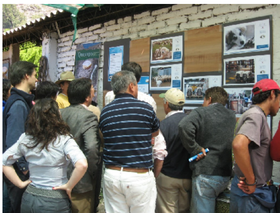
Plafó informatiu on hi havien els logos de Caixa Catalunya i de l'Institut, a més de moltes fotos dels MPR'S treballant controlats per l'Institut.