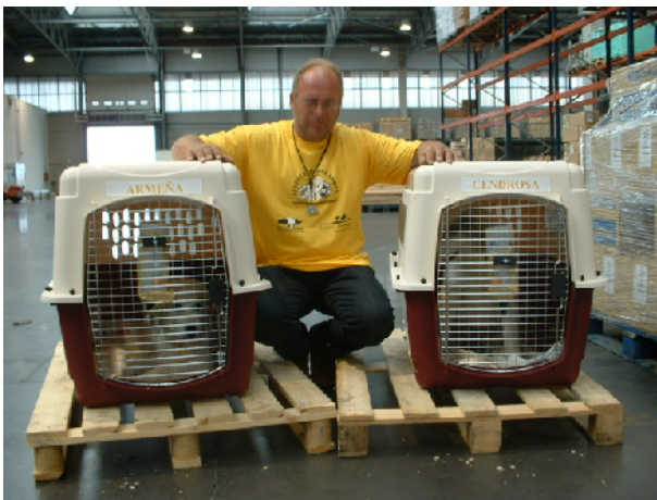
Un tècnic de l'Institut a la sortida de l'aeroport de BCN

En conseqüència, en data 22 de Setembre els hi vam enviar dues cadelles: Cendrosa de Cal Manistró i Armeña de Cal Gilet. Tenim previst enviar-lis a partir del 17 de Novembre un cadell mascle d'una altra cadellada que va néixer el 17 d'Agost en un ramat d'Andorra controlat per l'Institut. I d'aquí a tres mesos els hi enviarem una altre gosseta que justament va néixer el 8 d'aquest mes d'Octubre. L'acollida a Xile de les cadelles no podia ser més ben rebuda i per il·lustrar-ho adjuntem unes quantes fotografies de la sortida de l'aeroport de Barcelona, de l'arribada a l'aeroport de Xile i de la presentació i lliurament de les gossetes als ramaders per part de la mateixa Ministra d'Agricultura del govern Xilè.