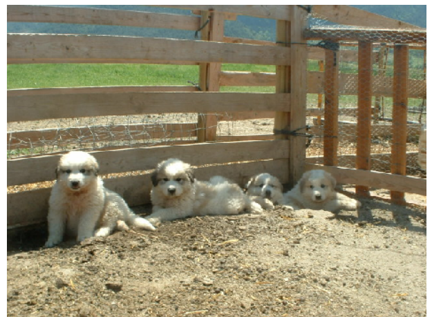
Cadellada de Cal Manistró a l'edat de 7 setmanes.