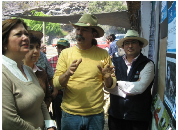
La Ministra d'Agricultura i el director de la FIA escoltant les explicacions de l'ingenier agrònom ejecutor del projecte, davant del plafó informatiu.